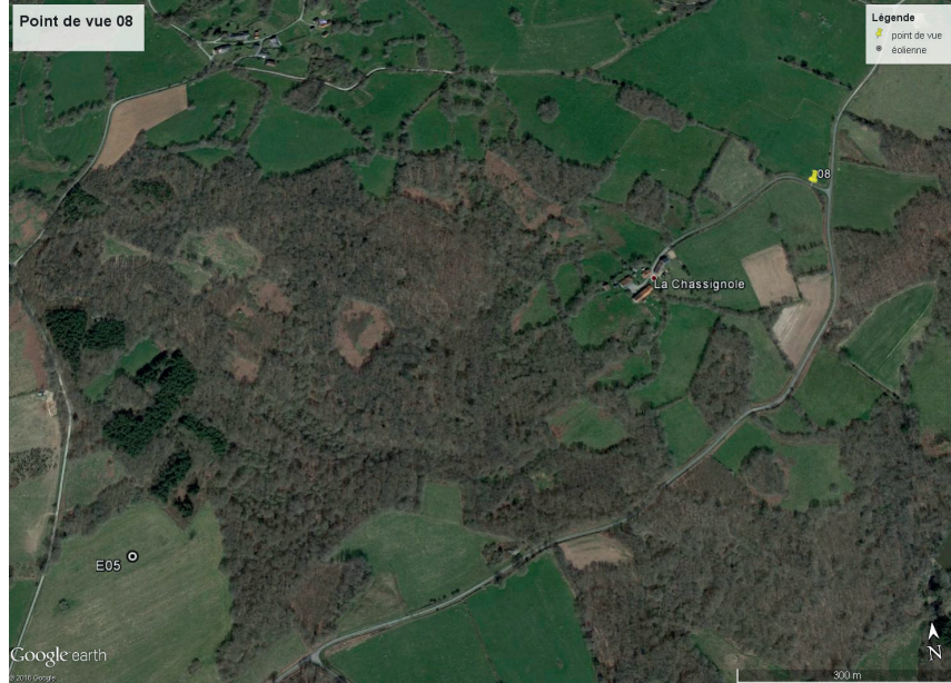
Contexte du point de vue (éoliennes les plus proches représentées)