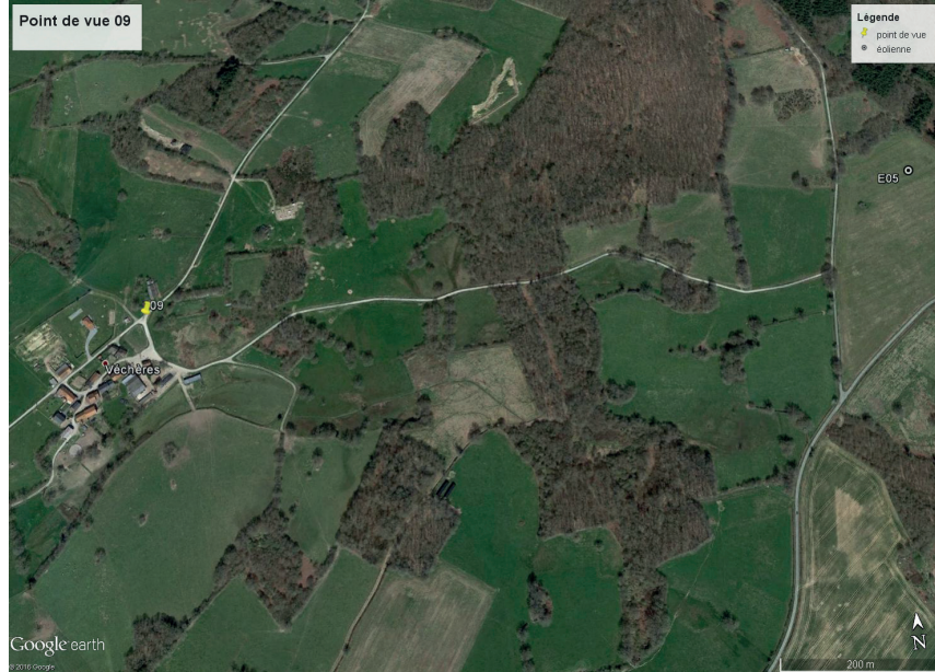
Contexte du point de vue (éoliennes les plus proches représentées)