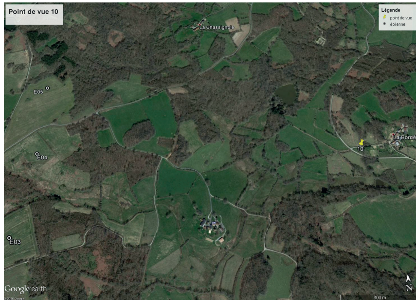
Contexte du point de vue (éoliennes les plus proches représentées)